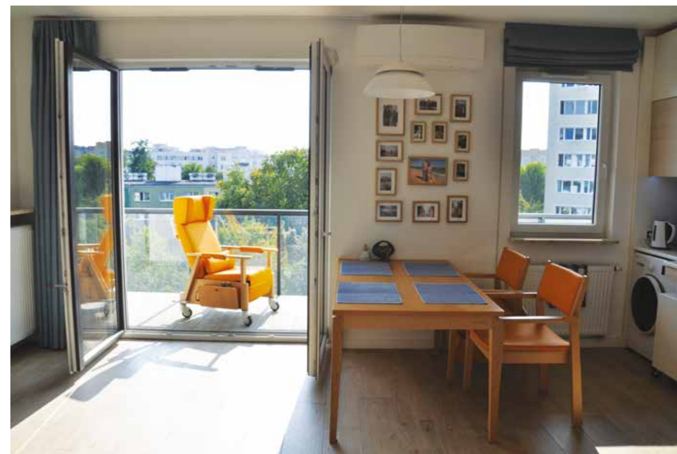
Fotografia 2. Mieszkanie z widokiem i dostępnym balkonem.