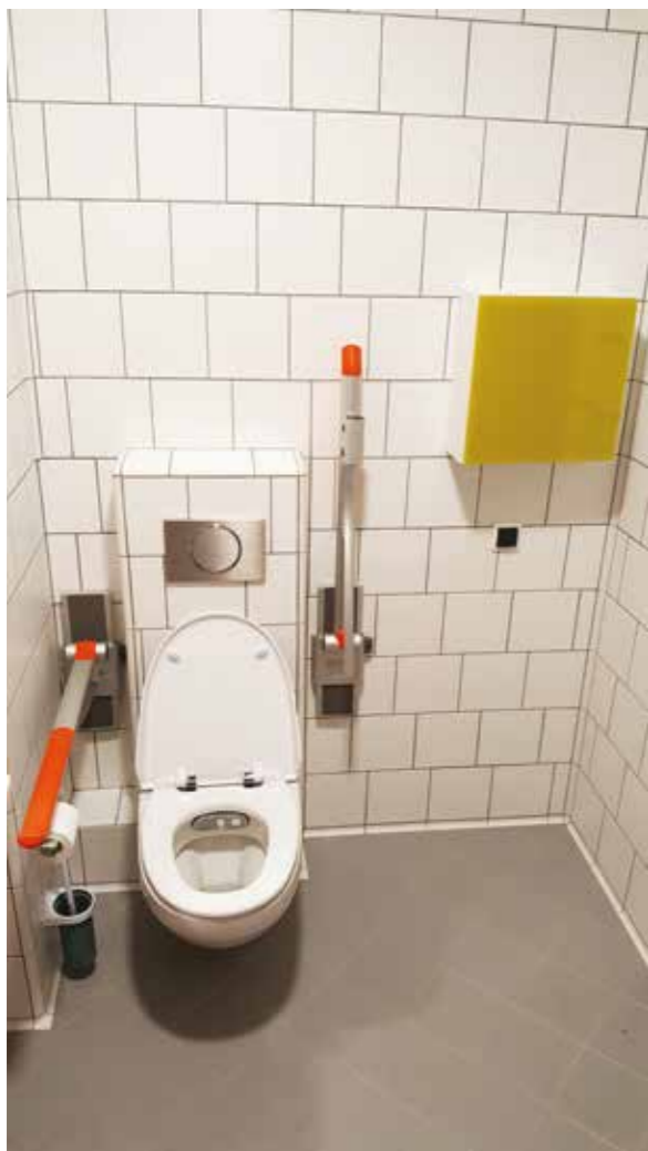
Fotografia 7. Toaleta z funkcją mycia. Zapewniona strefa przesiadania się z wózka i regulowane pochwyt.