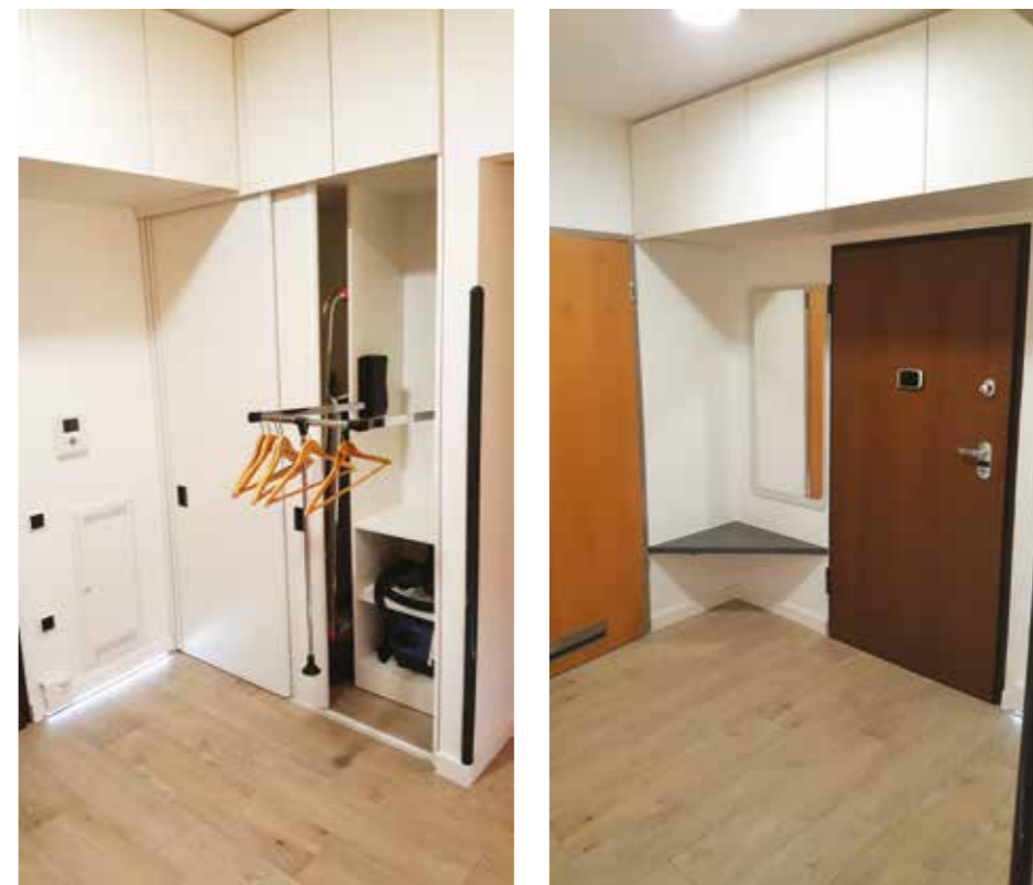
Fotografia 8. Dostępna garderoba w przestronnym przedpokoju. Kontrastowe oznaczenie przełączników i uchwytów. Siedzisko.