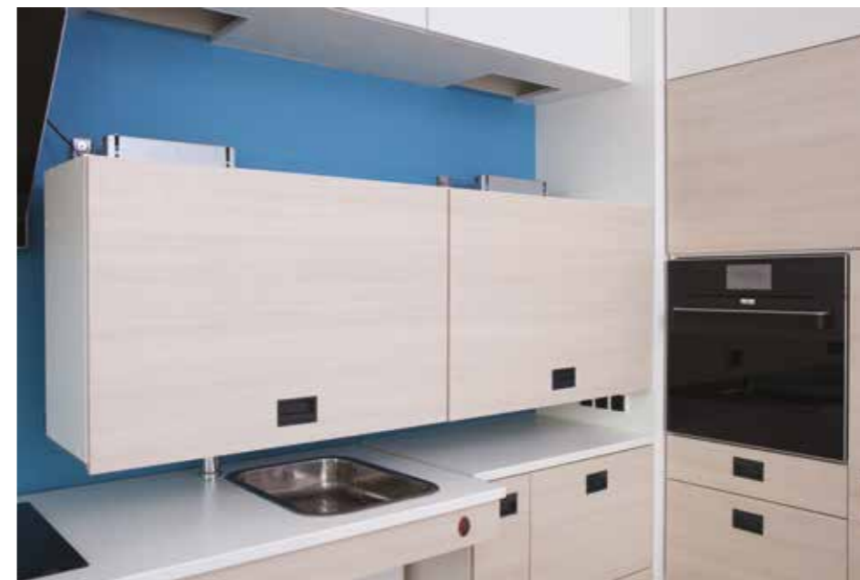
Fotografia 4. Dostępna kuchnia. Regulowana wysokość blatu. Sprzęty możliwe do obsługi z wózka. Brak potrzeby schylania się i nadmiernego sięgania w górę. Drzwi szafek górnych uchylane do góry.