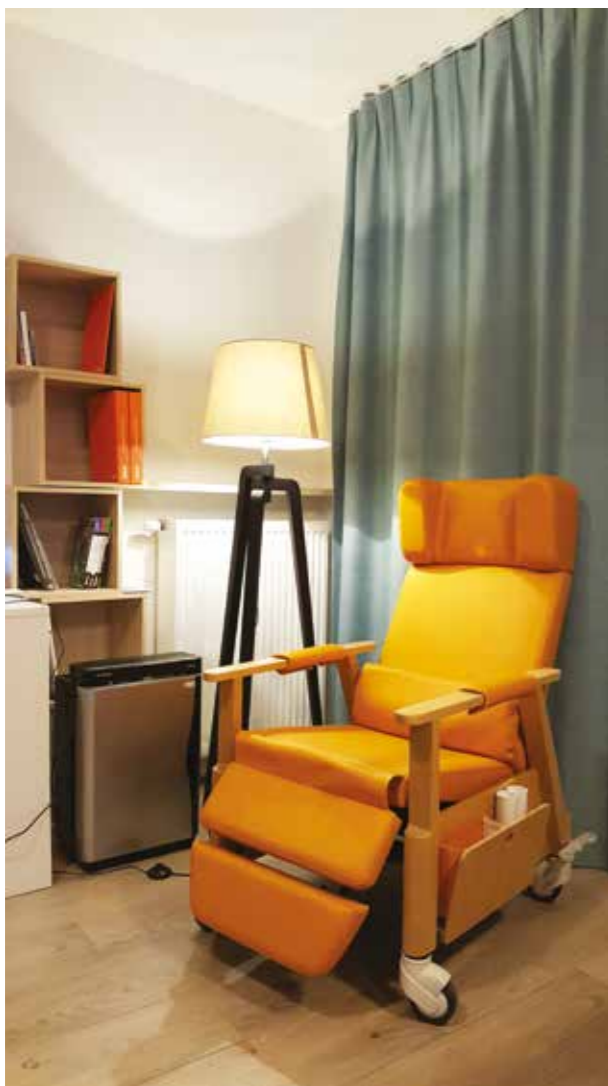
Fotografia 10. Przykład bezpiecznego i komfortowego fotela. Możliwa jest łatwa zmiana położenia fotela jak również regulacja oparcia i nóg. Miejsce do lek- tury w sąsiedztwie.